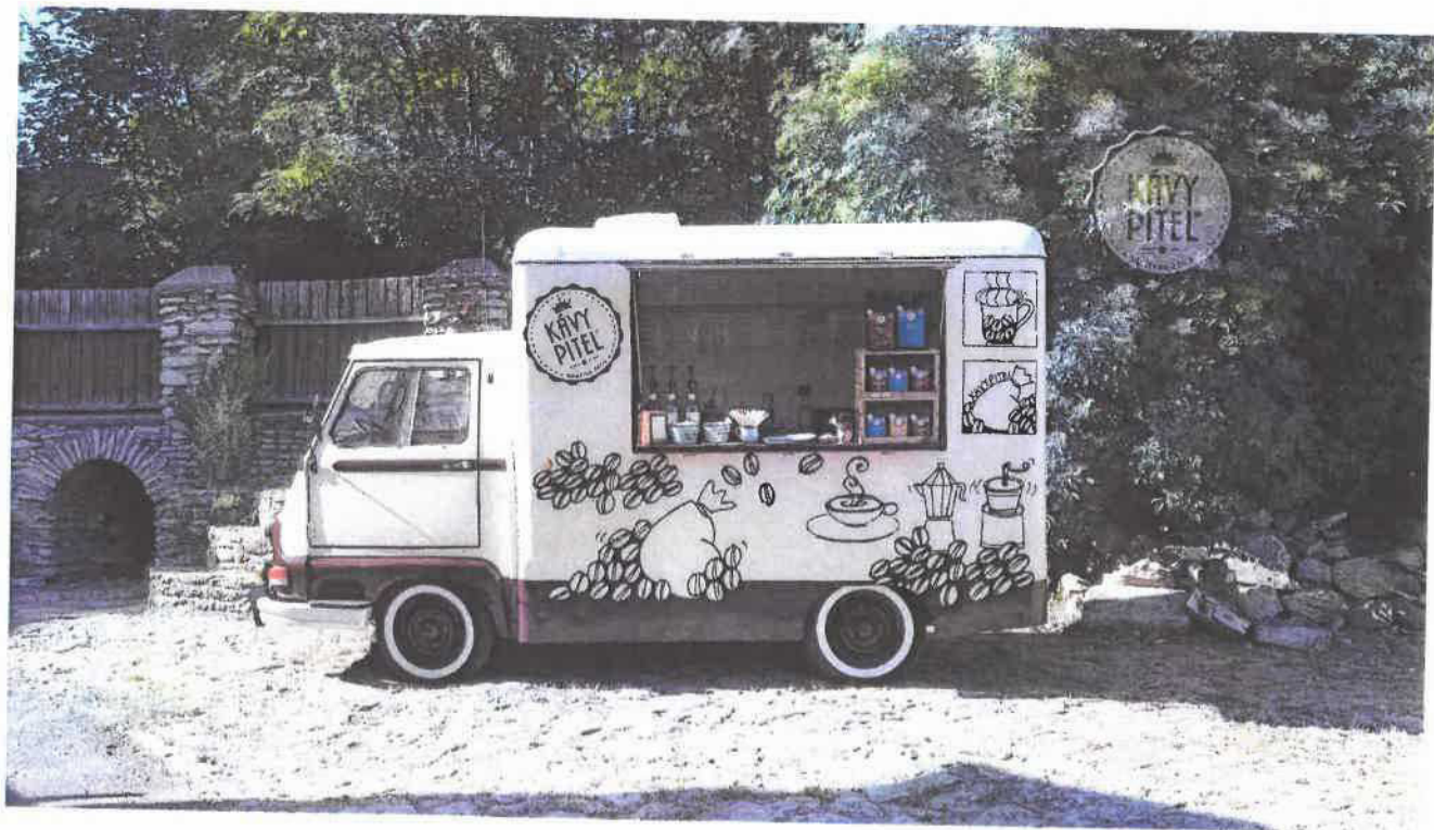
Příloha č.3 – Podoba stánku