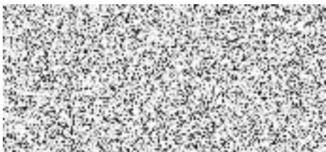
Marek Ztracený s.r.o.