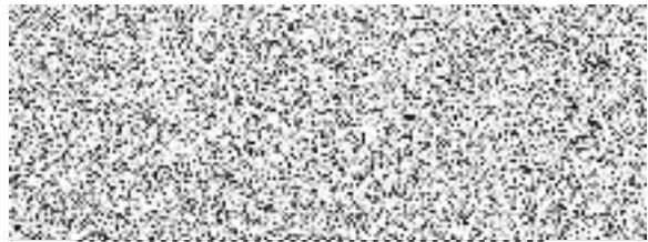
KHnet.info, o.s. nájemce