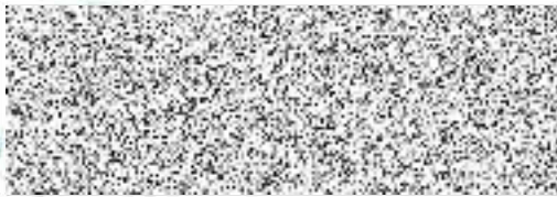
Město Kutná Hora pronajímatel