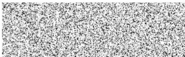
MĚSTO KUTNÁ HORA pronajímatel