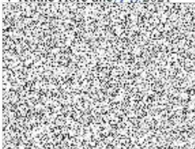
Město Kutná Hora objednavatel