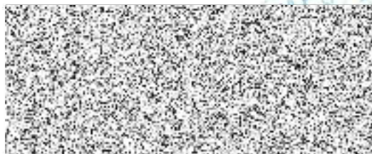
Město Kutná Hora půjčitel