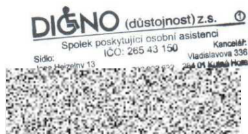
předsedkyně Digno (důstojnost) z.s.

Za správnost dokumentu zodpovídá Kontrola právníkem dne: 14.2.2022