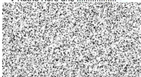
starosta města Kutná Hora