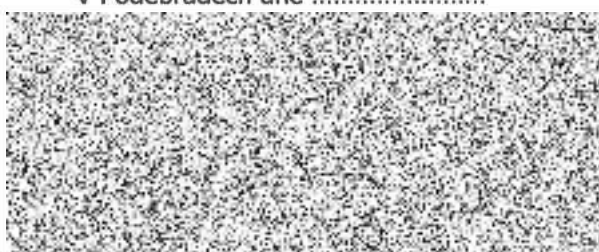
jednatel LKA s.r.o.